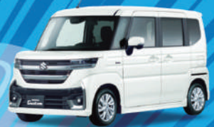
スペーシア カスタム