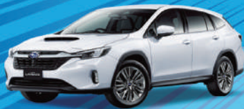
レヴォーグレイバック